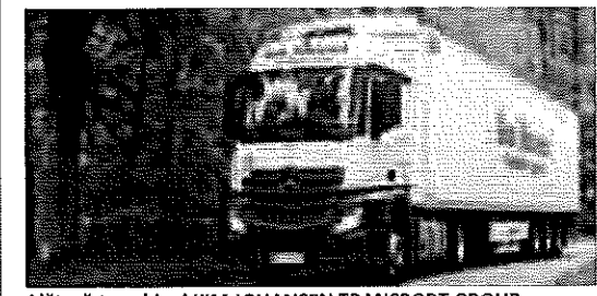
Alătură-te echipei KIM JOHANSEN TRANSPORT GROUP

● Serviciul Public Pavaje Spații Verzi Călărași, cu sediul în localitatea Călărași, str.I.L.Caragiale, nr.1 bis, județul Călărași, organizează concurs pentru ocuparea postului contractual temporar vacant în temeiul legii HG 286 de Monitor