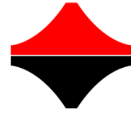
Institutul de Cercetare- INCERTRANS S.A.